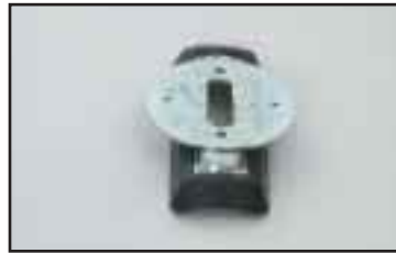
Kaareva tarrain putkimaisten esineiden; akselien ja lieriöiden käsittelyyn. Säde valmistetaan käsiteltävän kappaleen mukaiseksi.