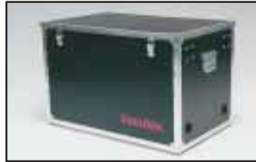
Äänenvaimennuslaatikko sopii kaikkiin sähköisiin alipainepumppuihin.