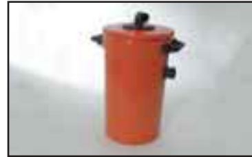
Iso suodatin epäpuhtaisiin olosuhteisiin.