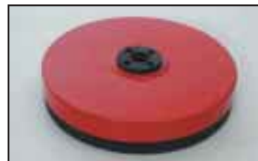
Pyöreä tarrain, jossa pehmeä solukumireunus. Sopii tynnyreille, purkeille, kiville jne. Useita eri kokoja.