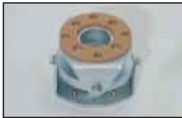
Kaksoisnível pitää nostoletkun suorassa sivuttaiskuormituksessa.