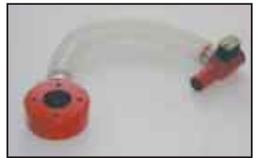
Vapautusventtiili jatkettulle käyttölaiteelle. Helpottaa kuorman irrottamista käytettäessä ylisuuria tarraimia.