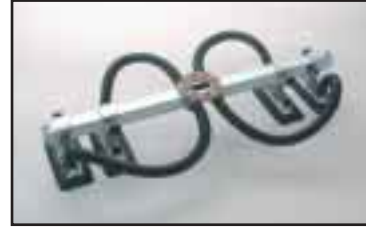
Työkalu jossa neljä säädettävää tarrainta sopii esim. kuperille ja pitkille esineille. Useita eri mitoituksia.