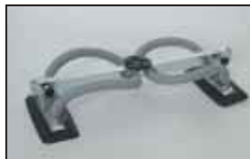
Työkalu jossa kaksi säädettävää tarrainta sopii esim. taitettaville pahvipakkauksille. Saatavana usealla eri mitoituksella.

Vaculexilla on suuri valikoima erilaisia tarraimia jotka sopivat useimpiin nostettaviin esineisiin. Vakiotarraimien lisäksi tarjoamme mielellämme asiakaskohtaisen ratkaisun.