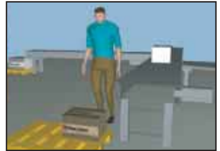
Esim 1. Nosto lavalta pöydälle kääntyen. 10 kg laatikko, 1 nosto/tunti = 14% nostajista saa vaivoja 2 vuoden sisällä. 15 kg laatikko, 1 nosto/tunti = 41% nostajista saa vaivoja 2 vuoden sisällä.

Lisätietoja eri nostotutkimuksista saat Movetec Oy:stä ( www.movetec.fi ).