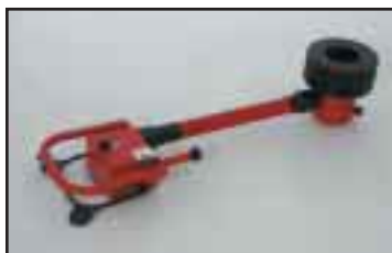
Kiinteä pitkä käyttölaite suurille kappaleille. Tarrain voidaan asettaa painopisteeseen selkää koukistamatta.