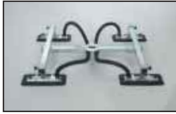
H-tarrain säädettävissä kaikissa suunnissa. Suurille levymäisille kappaleille. Useita versioita.