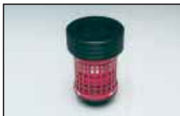
Suojaventtiili estää nostoletkun äkillisen ylös tempautumisen kuorman irrotessa. Asennetaan nostoletkun ja imupään väliin.