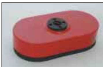
Ovaalitarrain jossa pehmeä solukumitiiviste. Pääasiassa säikeille, mutta myös kalvopakkauksille. Useita kokoja.