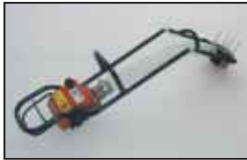
Nivelöity pitkä käyttölaite. Suurille kappaleille, sekä lastattaessa korkealle. Erilaisia pituuksia.