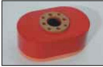
Ovaali tarrain, jossa pehmeä solukumireunus. Pääasiassa säikeille, mutta myös kalvopak-kauksille. Useita kokoja.