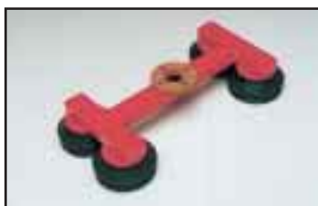
H-tarrain haitarikupeilla. Sopii epätasaisille pinnoille tai pinnoille joissa on korkeuseroja. Eri malleja.