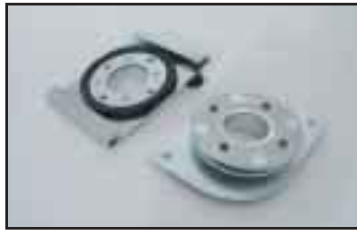
Pikaliitin jolla voidaan yksinkertaisesti ja nopeasti vaihtaa tarrain/työkalu.