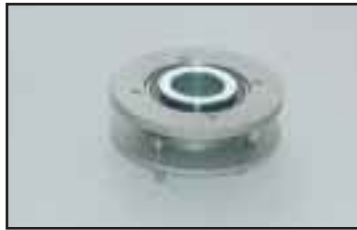
Pohjalaakeri. Kuormaa voidaan käännellä käyttökahvaa liikuttamatta 360°. Esim. lastaus viivakoodi ulospäin.