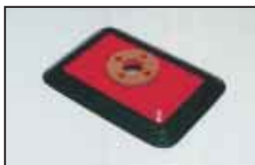
Suorakaidetarrain laatikoille, levyille jne. Useita kokoja.