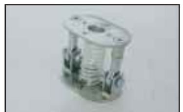
Kulmanível esim. levyjen käsittelyyn pysty- tai vaaka-asennossa.