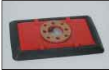
Suorakaidetarrain laatikoille, levyille jne. Useita kokoja.