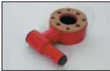
Vapautusventtiili vakiokäyttö-laitteelle. Helpottaa kuorman irrottamista käytettäessä ylisuuria tarraimia.