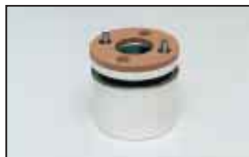
Pohjalaakeri jolla voidaan nostettavaa esinettä kääntää 360 astetta käyttökahvaa liikuttamatta.