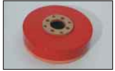
Pyöreä tarrain jossa pehmeä solukumitiiviste. Purkeille, tynnyreille, kiville jne. Useita kokoja.