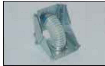
Kulmanivel jota käytetään esimerkiksi käännettäessä levyä pystysuorasta vaakasuoraan tai päinvastoin.