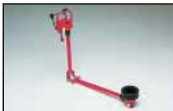
Nivelöity pitkä käyttölaite. Suurille kappaleille, sekä lastattaessa korkealle. Erilaisia pituuksia.