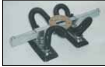
Työkalu jossa kaksi säädettävää tarrainta sopii esim. taitettaville pahvipakkauksille. Saatavana usealla eri mitoituksella.