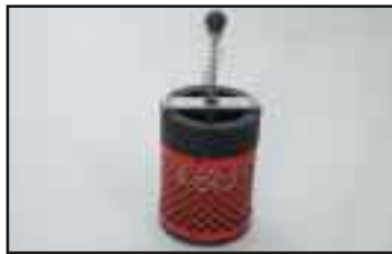
Suojaventtiili estää nostoletkun äkillisen ylös tempautumisen kuorman irrotessa. Asennetaan nostoletkun ja imupään väliin.