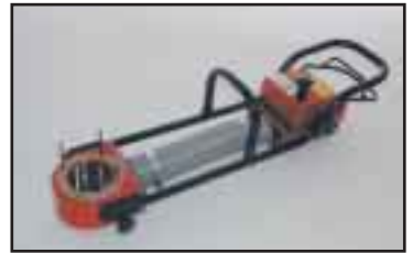
Kiinteä pitkä käyttölaite suurille kappaleille. Tarrain voidaan asettaa painopisteeseen selkää koukistamatta.