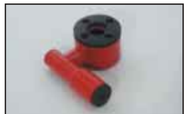
Vapautusventtiili jatkettulle käyttölaiteelle. Helpottaa kuorman irrottamista käytettäessä ylisuuria tarraimia.