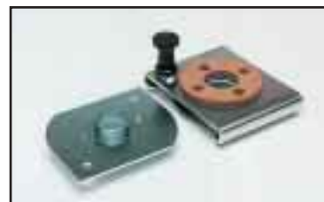
Pikaliitin jolla voidaan yksinkertaisesti ja nopeasti vaihtaa tarrain/työkalu.