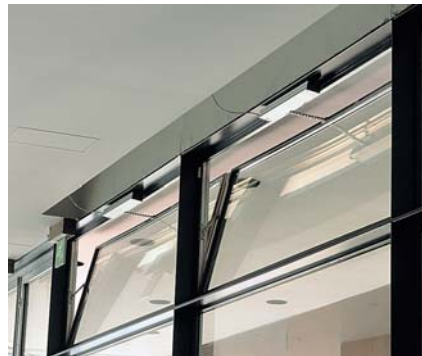
Hartwall-Areena, Helsinki. Movetec Oy on toimittanut Hartwall Areenaan 1S- ja 1M-savunpoistoavaajat sekä 1S5-savunpoistokeskukset.